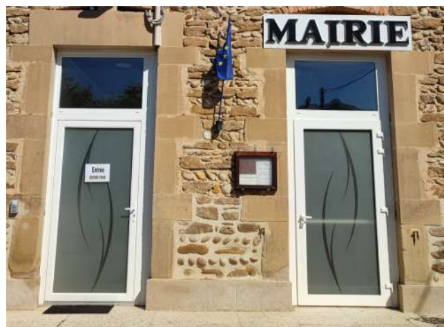
RENOVATION ENTRÉE DE LA MAIRIE :