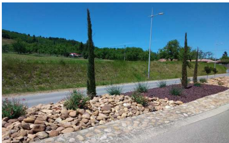
L'ILÔT CENTRAL ENTRÉE SUD: