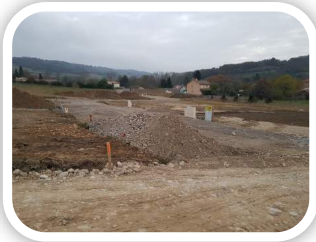
LA PASSERELLE FINALISÉE :