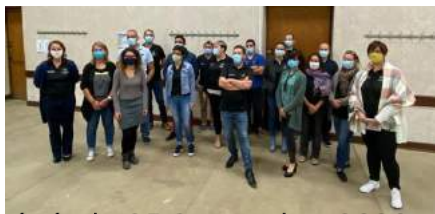
L'assemblée générale 25 Septembre 2020