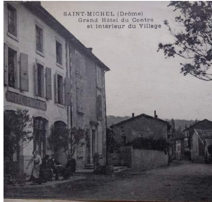
SAINT-MICHEL (Drôme) Grand Hôtel du Centre et intérieur du Village