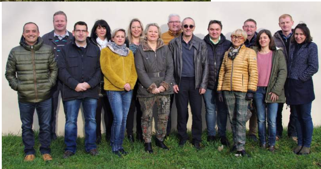
Le Nouveau Conseil municipal